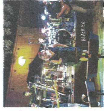
Black Ice se produira le 23 juillet. BLACK ICE

Les associations et la municipalité proposent une journée de festivités le 23 juillet